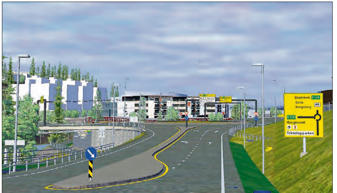
SKULPTUR: Denne rundkjøringen blir utsmykket med en såkalt møbius.