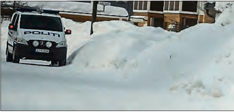
TYVERI FRA EN BOD: En kvinne har erkjent forholdet.