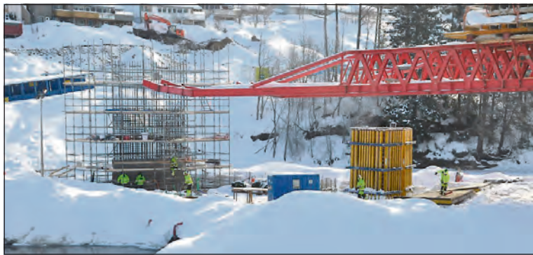
KALDT: Det har vært mange kuldegrader og sur vind de siste dagene, men arbeidet på Kongsberg bru går som planlagt.