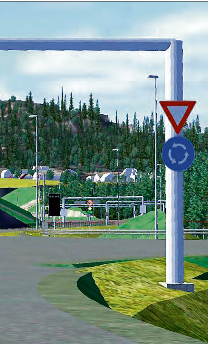
MODELL: NORCONSULT AS/VIEL BJERKESET ANDERSEN

- Kvinnen er avhørt og anmeldt, også blir det opp til politjuristen å vurdere reaksjonen, sier Myrhold.