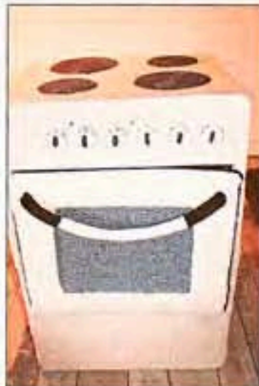
OVN: Frå vandreutstillinga Strikk-masker i samtidskunsten.