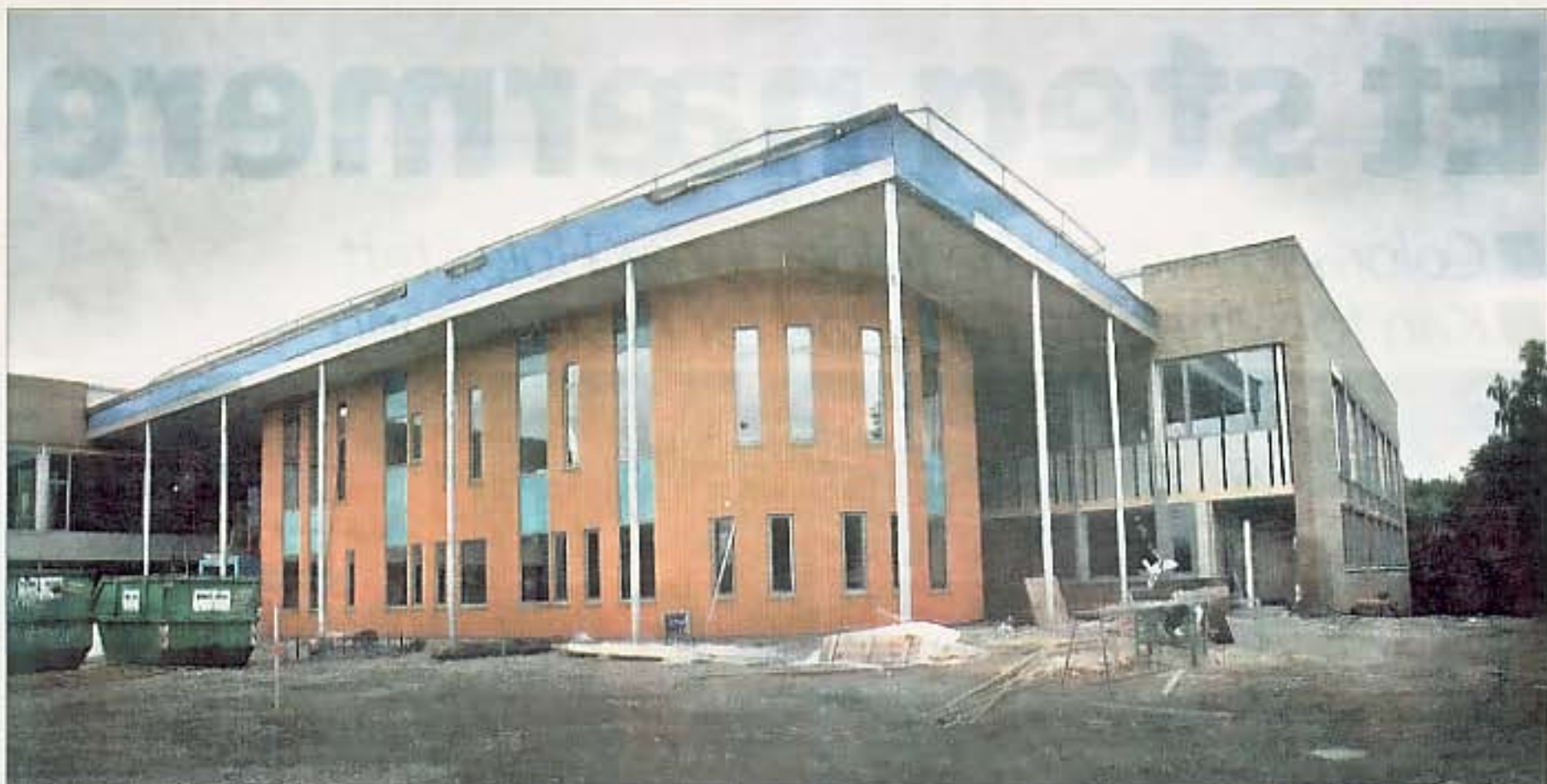
SNART NY: Nye Grålum Ungdomsskole åpnes offisielt 17. desember. Den kunstneriske utsmykningen er klar i august 2009. Bildet er tatt under utbyggingsarbeidet i september.

Vi var våkne litt lenge i natt Black Sheeps Emelie Nilsen etter at bandet vant den nordiske Melodi Grand Prix Jr.-finalen